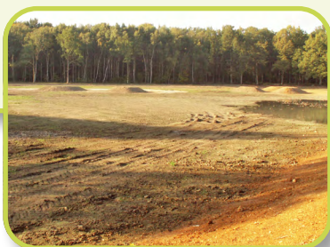
PNR du Perche