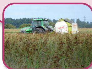
N. Fillole - PNR MCB

Dans les Marais du Cotentin et du Bessin, le recul des dates de fauche permet aux nichées d'arriver à terme ; l'absence de fertilisation permet l'épanouissement des prairies tourbeuses tandis que d'autres contrats proposent une maîtrise du nombre d'animaux pâturant pour favoriser le Vanneau huppé. Près de 44 % de la surface agricole bénéficie de tels contrats (soit près de 500 dossiers). Au total, ce sont près de 1 500 000 € de crédits nationaux et européens qui viennent ainsi soutenir l'économie agricole locale chaque année.