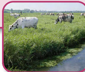
B. Canu - PNR MCB

Pour en savoir plus sur l'actualité du réseau Natura 2000 en Normandie, n'hésitez pas à consulter notre rétrospective 2019 : http://www.normandie.developpement-durable.gouv.fr/journee-europeenne-natura-2000-a3312.html