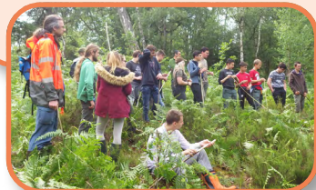
P. Hambarid - DDIM27

La validation en 2018 d'un barème forfaitaire régional pour la mise en œuvre de certaines actions des contrats Natura 2000 a permis l'émergence, sous l'impulsion du Département de l'Eure, de 3 projets de préservation d'arbres sénescents - vieillissants - au sein des sites Natura « Vallée de l'Eure » et « Risle, Guiel, Charentonne ». Ce fut l'occasion d'impliquer directement des propriétaires forestiers privés dans la contractualisation, en lien avec la direction départementale des territoires et de la mer, le centre régional de la propriété forestière de Normandie, le Conservatoire d'espaces naturels de Normandie, le Groupe mammalogique normand, avec l'opportunité d'associer d'autres actions en faveur des pelouses, mégaphorbiaies, ou encore de l'unique hectare de lande sèche du site Natura 2000 de la Vallée de l'Eure présent au sein du domaine du Parc de Pinterville. Les financements État/FEADER prévus pour l'ensemble de ces opérations s'élèvent à 78 331 €, au bénéfice du territoire.